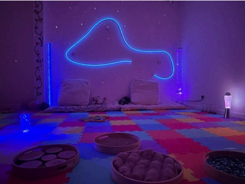
L'espacesensoriel et inclusif